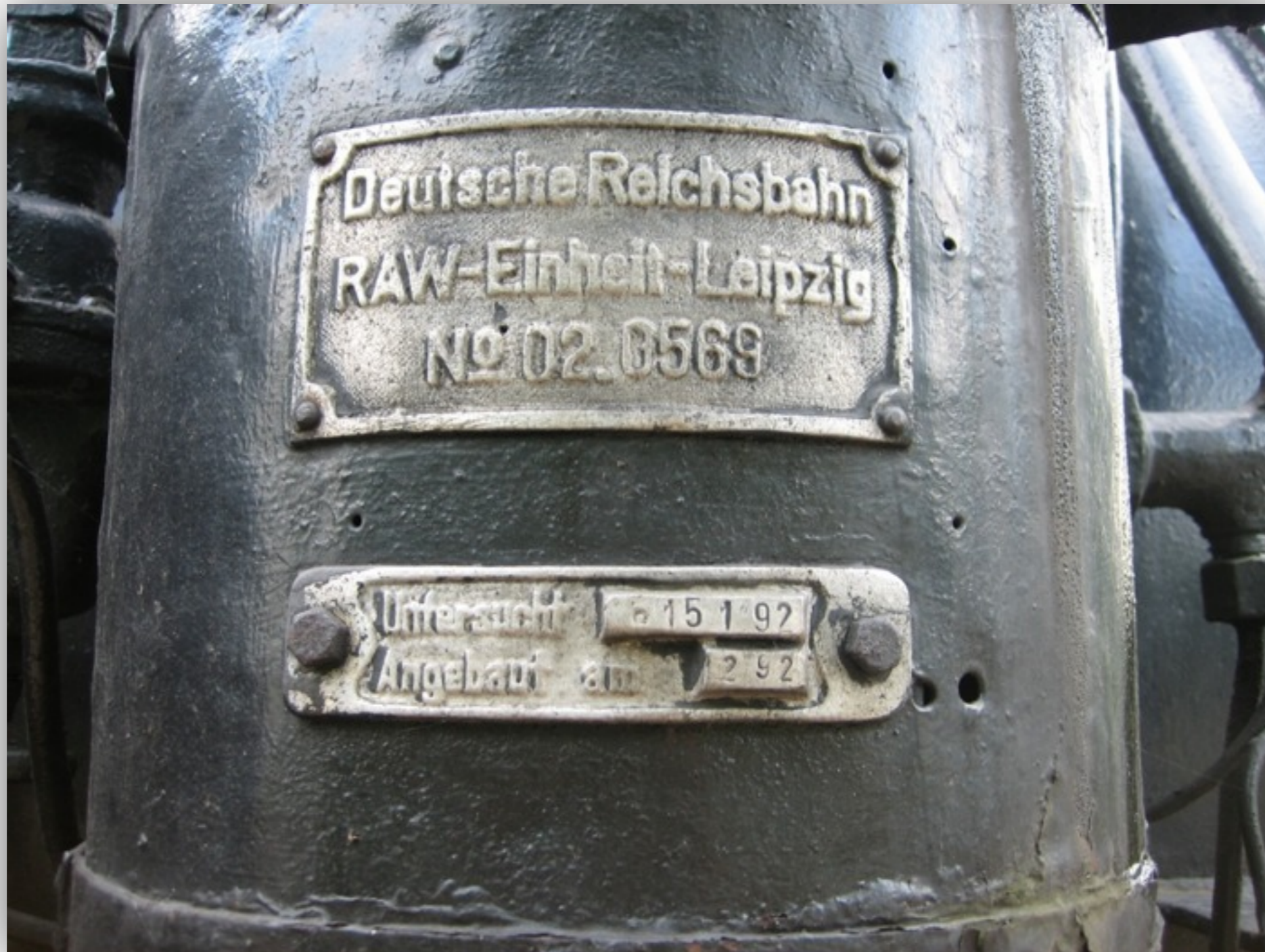
JUG saxony – Rank und Schlank